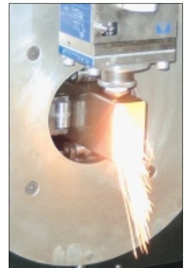
De ondersteuning en klemelementen passen zich immers telkens aan de vorm van het te verwerken profiel aan, zowel ronde als niet-ronde secties

tussentransportsysteem werden door hen toegeleverd. Ten slotte was ook de service een belangrijke factor. Balliu en BEWO bezitten een gecombineerd verkoop- en servicenetwerk en er wordt ook samengewerkt met een lokale technische staf die speciaal daarvoor naar België is gekomen om opleiding te volgen. Voorts maakt Balliu bewust ook enkel gebruik van erg kwalitatieve componenten. Zo zijn alle machines uitgerust met hoogwaardige Siemens-sturingen, Precitec-snijcomponenten, verschuinde